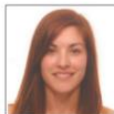
Mercedes Sales & Att.